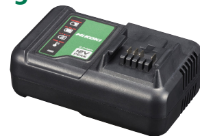
UC12SL V.68030613 N.55470898