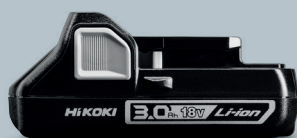
18V 3,0 Ah BSL1830C