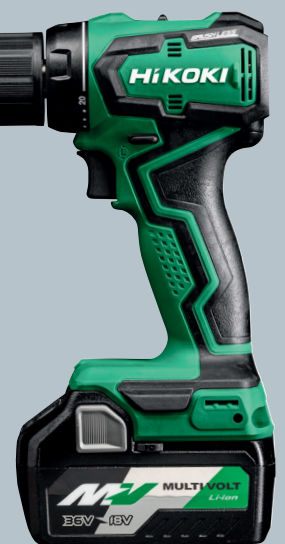
MULTI VOLT 4,0/8,0 Ah BSL36A18