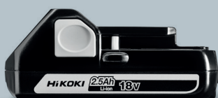
18V 2,5 Ah BSL1825

DS18DD er kompatibel med flere batterier med slide-batteriinnfetting. For eksempel 18V-batteriene BSL1825, BSL1830C, BSL1850 og BSL1850C. Selvsagt passer også våre MULTI VOLT-batterier. Du kan dermed enkelt bytte batterier mellom arbeidsoppgavene! Det betyr også at om du allerede har HiKOKI-batterier, så er sjansen stor for at du kan bruke de med DS18DD!