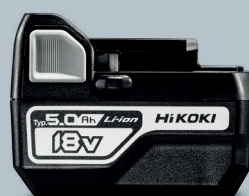
18V 5,0 Ah BSL1850C