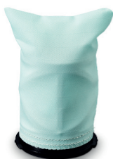
Høyeffektivt filter 66376509