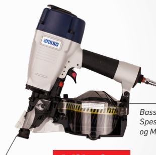
Basso C29/65-C1: Spesialpistol for Decra og MFT spikerskrue.