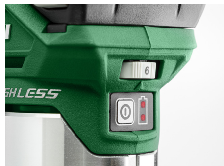
Variabel hastighetskontroll for jobbing med forskjellige materialer.