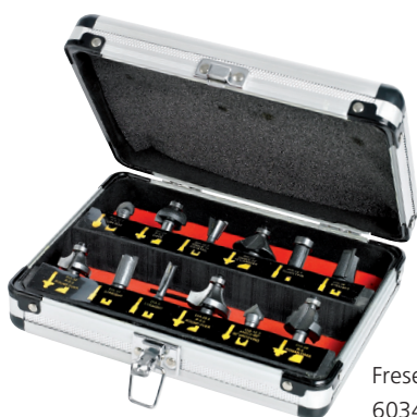
Fresestålsett 12 deler 60340035

Variabel hastighet muliggjør mange forskjellige applikasjoner. Men for å utføre jobbene trenger du også tilbehør. Husk tilbehør som er egnet for oppgavene du skal utføre.