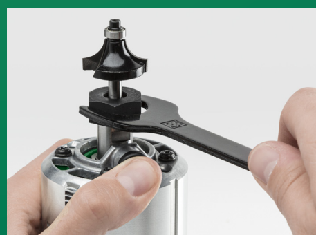
Spindellås for enkelt verktøybytte.

Denne maskinen med 18V batteridrift er utstyrt med en rekke velutviklede funksjoner som vil gjøre jobben behagelig å utføre - perfekt tilpasset brukerens behov og materialets egenskaper. Du kan bl.a. enkelt regulere hastigheten med et hastighetsreguleringshjul. Verktøyfestet har spindellås og lar deg raskt bytte bits.